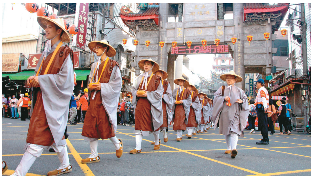
↑佛光山「百萬人興學」行腳托鉢，10月12日從嘉義城隍廟出發。

佛光山百餘位行腳僧從嘉義城隍廟出發後，沿著市區主要街道行腳托鉢，有民衆推著坐輪椅的年邁長者、抱著出生不久的嬰兒、牽著寵物，虔誠恭敬投鉢，也有人