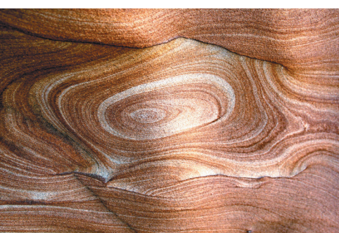
同心圓 / 野柳

石頭，蘊含著許多種礦物質，歷經千百年風吹雨打，與浪花的不斷沖刷，於天地間呈現出千奇百怪的造型與圖畫。